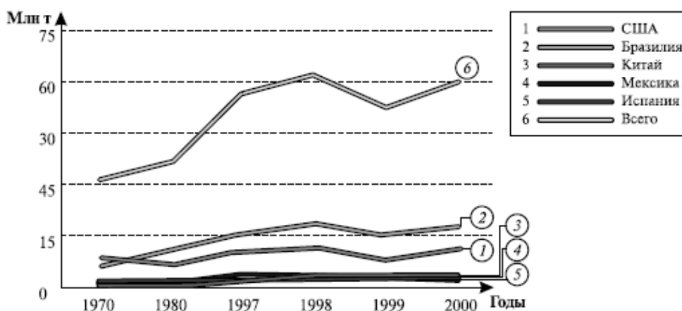
Рис. 5. Производство апельсинов в мире

В Бразилии и США, главных «апельсиновых» державах мира, в последние годы собирают рекордное количество апельсинов (рис. 5).