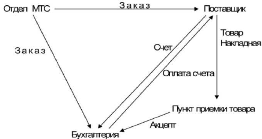
Рис. 1. Существующая организация процессов закупок в компании Ford

В бухгалтерии производится снова сверка накладной, счета и заказа (контракта), и в случае отсутствия расхождений выполняется оплата счета. По такой схеме возможны длительные выяснения возникающих несогласований в документах с поставленным товаром и, как следствие, невозможность быстрого использования материалов в производственном процессе, возвраты товаров и повторные поставки.