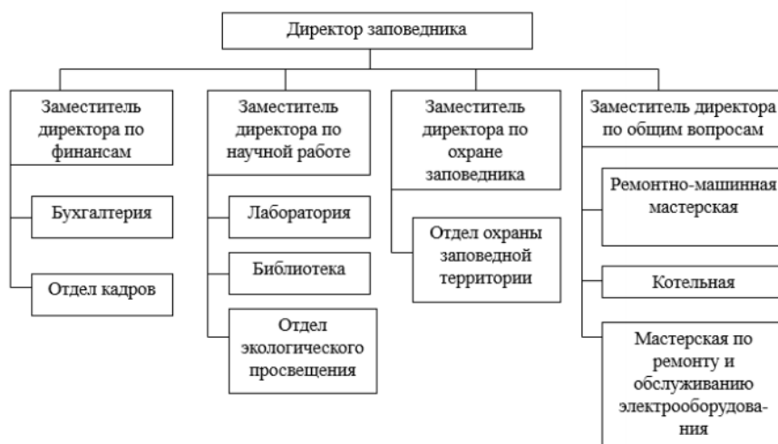
Рисунок 1. Организационная структура ФГУ «Государственный природный заповедник «Северная звезда»

Деятельность ФГУ «Государственный природный заповедник «Северная звезда» осуществляется на основе сметного финансирования из федерального государственного бюджета. Организационная структура представлена на рисунке 1.