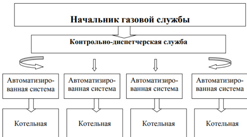
Рисунок 2 – Обслуживание котельных САУ

Предприятие планирует перевод котельных на системы автоматизированного управления (САУ), которые осуществляют автоматический контроль работы оборудования котельных и не требуют постоянного присутствия рабочих в котельной. Схема обслуживания котельных с САУ изображена на рисунке 2. Система управления работой котельных принципиально изменится. Появляется возможность вместо штата работников каждой отдельной котельной организовать один пункт контрольно-диспетчерской службы, осуществляющий дистанционный контроль текущей работы котельной. Следовательно, можно существенно сократить численность работников, занятых обслуживанием работы котельных.