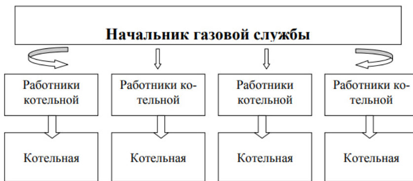
Рисунок 1 – Существующая схема обслуживания котельных

Численность персонала МУП «Теплый дом» – 63 чел. Значительная доля персонала предприятия, работает в территориально расположенных котельных. Общая схема обслуживания котельных представлена на рисунке 1.