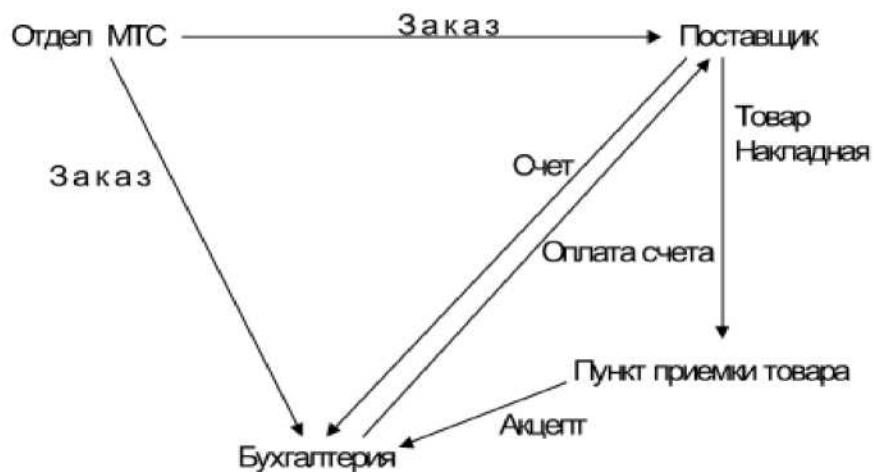
Рис. 1. Существующая организация процессов закупок в компании Ford

В результате проведения бизнес-реинжиниринга было принято решение, что должна быть организована распределенная база данных, в которую помещается информация заказа (рис.2).