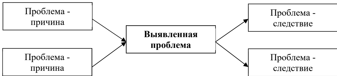
1. Схема причинно-следственного анализа [5] От текста рисунок отделяется пропуском строки.

Пример оформления представлен на рис. 1. Иное оформление рисунков не допускается