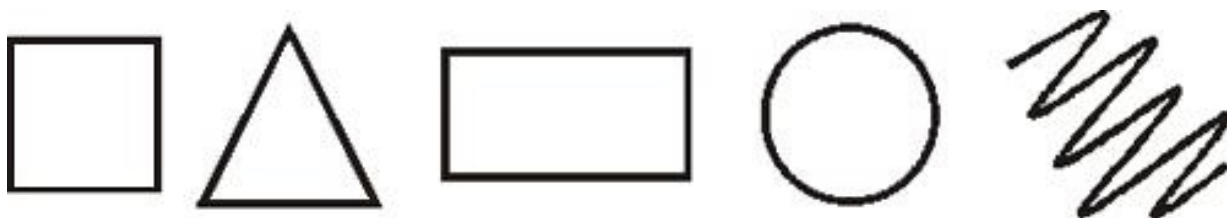
Рис. 2. Психометрический тест

Если Вы испытываете сильное затруднение, выберите из фигур ту, которая первой привлекла Вас, нравится больше остальных. Запишите под ее изображением цифру 1. Теперь проранжируйте оставшиеся четыре фигуры в порядке вашего предпочтения и запишите цифры под ними.