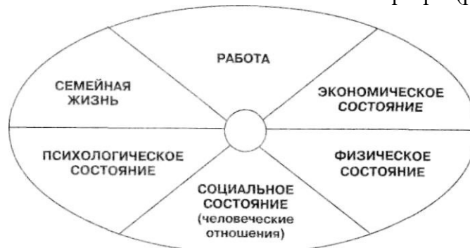
Рис. 1. Примерная структура личного жизненного плана карьеры руководителя

Менеджеру необходимо дать оценку сложившейся ситуации в организации и взвесить свои возможности и перспективы продвижения по службе. Для этого необходимо составить (если его нет) или уточнить свой личный жизненный план карьеры (рис. 1).