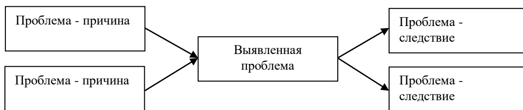
Рис. 1. Схема причинно-следственного анализа [5]

Пример оформления представлен на рис. 1. Иное оформление рисунков не допускается