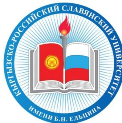
Кыргызско-Российский Славянский Университет (г. Бишкек, Кыргызстан)