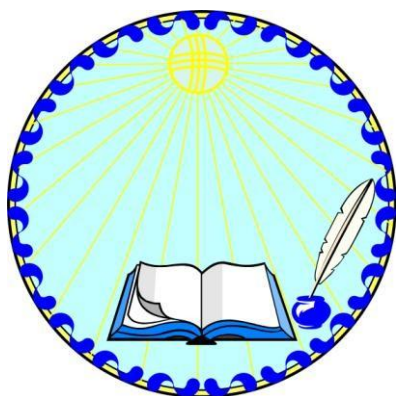
Академия экономики и права имени У.А. Джолдасбекова (г. Талдыкорган, Республика Казахстан)