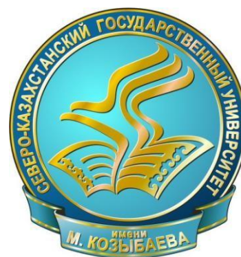
Северо-Казахстанский государственный университет им. М. Козыбаева (г. Петропавловск, Республика Казахстан)