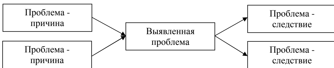
Рис. 1. Схема причинно-следственного анализа [5]

Пример оформления представлен на рис. 1. Иное оформление рисунков не допускается