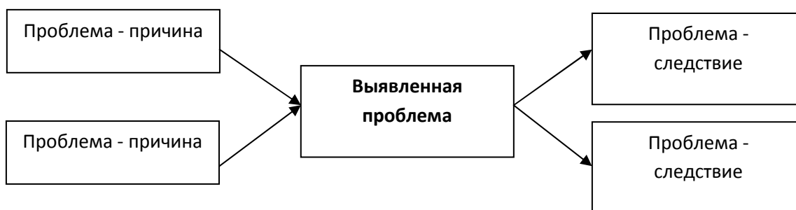
Рис. 1. Схема причинно-следственного анализа [5]

Пример оформления представлен на рис. 1. Иное оформление рисунков не допускается